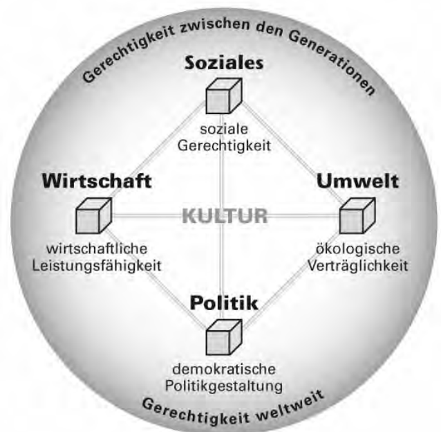
Abbildung 1: Orientierungsrahmen für den Lernbereich Globale Entwicklung, 2015, © Jörg-Robert Schreiber

Voraussetzung für einen solchen Weg ist die Existenz eines global gültigen Leitbilds. Es muss weit und offen genug sein, damit Entwicklungsakteure - Institutionen und Individuen - ihre Grundwerte einbringen und Entwicklungsziele verfolgen können: ein lernender Orientierungsrahmen, dessen Leitlinien in einem offenen Prozess konstruktiv ausgehandelt, wechselseitig bestätigt und - wo immer möglich und sinnvoll - in universell gültiges Völkerrecht überführt werden. Dieses Leitbild nachhaltiger Entwicklung (s. Abb. 1) ist – ausgehend von der Konferenz der Vereinten Nationen für Umwelt und