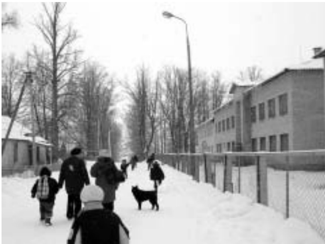
A view of the Belskoye Ustye orphanage for disabled children

Neuro-psychological orphanages are under the jurisdiction of the Ministry of Labour and Social Development , and not the Ministry of Education . Until recently disabled children were considered uneducable by the state and until now there are no federal educational programs or educational standards for them. Some children do not receive any education at all, and the few that do, follow an educational programme that covers only the first few years of primary school, although their potential is higher. The educators that work in these orphanages are not required to have any pedagogical education, and in reality, most have not even graduated from high school. Finally, children with learning difficulties, behavioural, social or medical problems or for whom there was no room in normal orphanages also live in neuro-psychological orphanages. In practice this means that they are also deprived of an education.