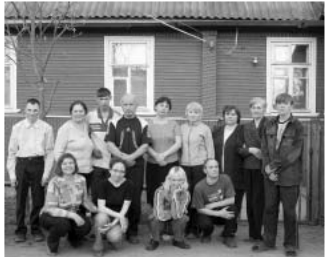
The Social hotel staff and the young disabled adults benefiting from the project.

visited their relatives on a regular basis and 12 visited host families on weekends and during holidays. The experience that a child gains growing up in his family or in a substitute family is unique. It cannot be taught to a child living in an institution through role-play or in a social adaptation class. The earlier an institutionalised child is placed in family-based care, the more chances he has of successfully integrating society and living independently or semi-independently.