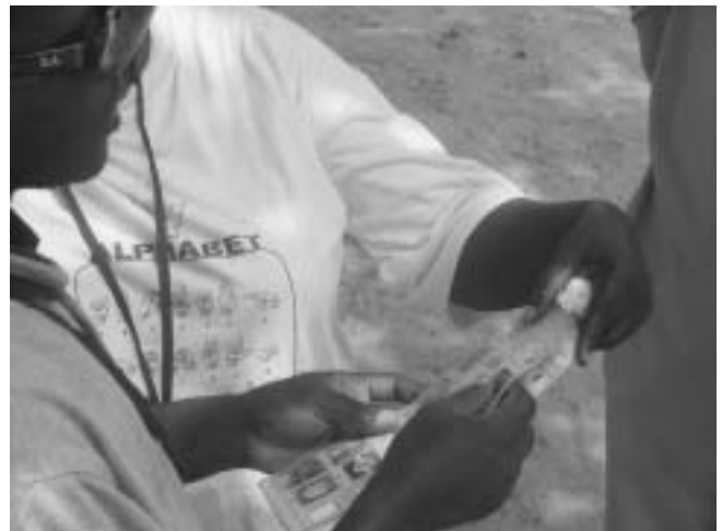
A blind voter being shown how to use the tactile ballot guide in Ghana

In Francophone West Africa, the Committee for Democratic Observance was established by DPOs to lobby for the greater inclusion and participation of disabled people in the 2005