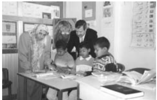
Educational support for hearing impaired children

In 1981-82, the United Nations Relief and Works Agency for Palestine (UNRWA) in cooperation with OXFAM-UK embarked on a Community-Based Rehabilitation Programme. At this time the Holy Land Institute for the Deaf became involved as a member of the steering committee.