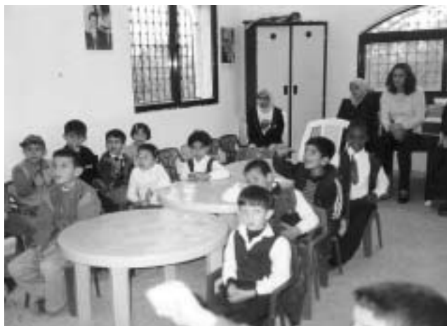
Children from Marka CRC visiting HLID School: In the classroom with HLID children

The Raja (Hope) Centre for Special Education (of