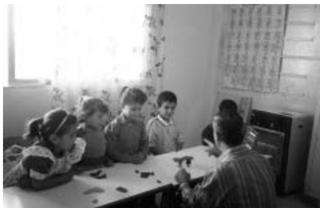
Children at Husn CRC during a mathematic session