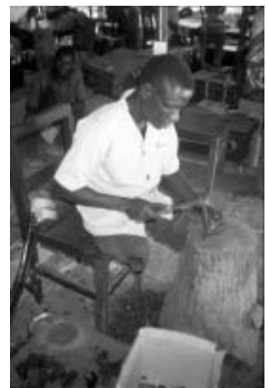
Bombolulu-Werkstätten in Kenia

Fairer Handel trägt durch seine Partizipationsmöglichkeiten für Menschen mit Behinderung zur Stärkung ihres Selbstbewusstseins, zur Förderung ihrer sozialen Anerkennung und zur Einkommensförderung bei. Der Faire Handel ermöglicht aber weit aus mehr. Einkommensförderung ist ein Instrument von vielen, um das eigentliche Ziel, das Empowerment von Menschen mit Behinderung und ihre gesellschaftliche