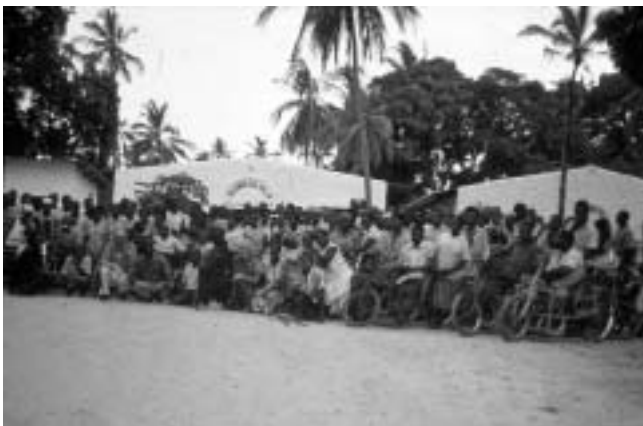
Bombolulu-Werkstätten in Kenia

Die Bombolulu-Werkstätten wurden 1969 von der kenianischen Behindertenorganisation Association for the Physically Disabled of Kenya in der Nähe von Mombasa mit der Unterstützung der methodistischen Kirche Kenias und der Christoffel Blindenmission gegründet. Heute bietet Bombolulu ca. 250 Menschen die Möglichkeit, einer Beschäftigung nachzugehen oder eine Ausbildung im Bereich des Kunsthandwerks oder der Herstellung von Kleidung zu machen. Die in den Werkstätten produzierten Produkte werden teils im Laden des angegliederten Kulturzentrums verkauft, teils über Fair-Handels-Organisationen vertrieben. Jährlich bewerben sich ca. 400 Menschen, von denen jedoch nur zehn Prozent eingestellt werden können. Mit einem Basisgehalt von 45 US$ deutlich über dem staatlichen Mindestlohn und einer Bezahlung nach