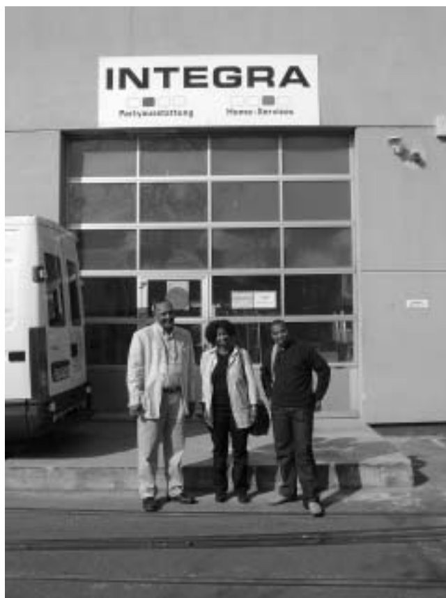
Der Vorsitzende der National Cleaning Association und die TeilnehmerInnen des aktuellen Austausches vor einer Integrationsfirma in Berlin

beworben hatten, in einem aufwändigen Selektionsprozess 40 TeilnehmerInnen ausgewählt und in eine Trainingsmaßnahme aufgenommen. Für das Auswahlverfahren haben MitarbeiterInnen von CMHS jede Familie aufgesucht, da die Teilnahmekriterien nicht nur auf den Menschen, sondern auch auf die soziale Unterstützung bezogen waren, um im ersten Arbeitsmarkt bestehen zu können. Und von diesen 40 TeilnehmerInnen wurden immerhin 23 tatsächlich beim ersten Anlauf in Arbeit gebracht. Schwerpunkte waren Reinigung, Kindergartenassistenz, Gärtnerarbeiten und Assistenz für Krankenschwestern. Dieses Projekt wird jetzt mit einem zweiten Förderstrang fortgesetzt. Diese Projekte zielen strukturell vielleicht auf etwas Ähnliches wie unsere Berufsbildungswerke. Allerdings sind das aus unserer Sicht noch sehr kurze Trainingseinheiten von bis zu drei Monaten, aber dann mit intensiver Unterstützung bei der Suche nach einem Arbeitsplatz. Immerhin, über die Hälfte der TeilnehmerInnen in Arbeit zu bringen, ist wirklich schon sehr gut.