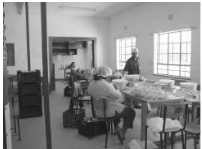
Blick in eine CMHS-Werkstatt

Ein zweites Beispiel: Als die südafrikanische Delegation hier in unsere Werkstätten kam, hatte sie den Eindruck von menschenleeren Hallen. Wie kann man so viele Quadratmeter für so wenig Menschen anmieten? In den Räumen, die Werkstätten hier zur Verfügung haben, hätten in Südafrika mindestens die doppelte wenn nicht die dreifache Anzahl von Personen gearbeitet. Bei uns ist jedoch durch die Werkstättenverordnung die Quadratmeterzahl genau festgelegt. Die CMHS hat natürlich auch ganz andere Maschinen in ihren Werkstätten drin stehen, das sind ganz andere Voraussetzungen. Aber da prallen wirklich sehr große Unterschiede aufeinander. Dahinter verbirgt sich zum einen der sehr geringe Technisierungsgrad der Werkstätten in Südafrika, zum anderen jedoch auch die Art der Beschäftigung, die für Menschen mit Behinderung dort – noch – gewählt wird. Im Moment gibt es einen zweiten größeren Prozess weg vom Kunsthandwerk, was ja auch bei uns in den Anfängen sehr typisch war; stärker hinein in Servicebereiche, also z.B. Wäscherei oder Gebäudereinigung. Das ist auch bei uns ein Prozess, der noch lange nicht abgeschlossen ist, da Servicebereiche Menschen mit Behinderung viel stärker in die Gesellschaft bringt als im geschlossenen Zimmer Kunstwerke herzustellen. Das ist auch etwas, was sich forciert hat.