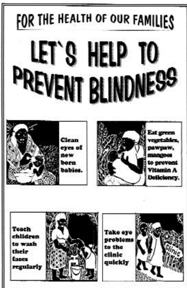
Abbildung 1: CAMPAIGN FOR PREVENTION OF DISEASES AND DISABILITIES by Services for Disabled People - Archdiocese of Abuja