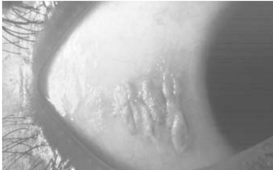
Abbildung 1: Bitot-Flecken sind Zeichen von Vitamin-A-Mangel

Vitamin-A ist auch im Spiel, wenn bei Masern Kinder erblinden. Schon in einer Studie in England von 1932 wurde bei Verabreichung von Lebertran, der reich an Vitamin-A ist, eine 50%-Reduktion der Kindersterblichkeit bei Fällen von Masern beobachtet. Leider wurde diese Studie damals nicht beachtet. Sie wurde erst wiederentdeckt, als zwei neuere Studien diese Wirkung von Vitamin-A bestätigten.